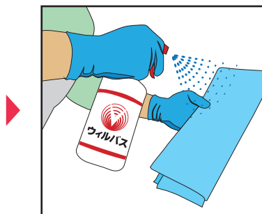
クロス表面にスプレーする