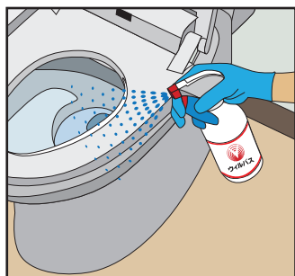
対象箇所に直接スプレーする